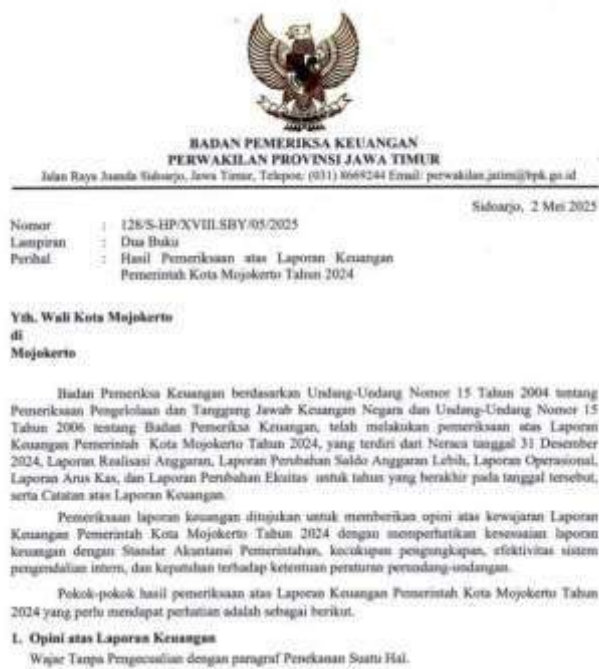
Gambar 3. 2 Hasil Pemeriksaan atas Laporan Keuangan Pemerintah Kota Mojokerto Tahun 2024

Target dan realisasi 2025 atas indikator kinerja opini BPK telah tercapai yakni dengan diraihnya penghargaan kepada Pemerintah Kota Mojokerto atas keberhasilannya menyusun dan menyajikan Laporan Keuangan Tahun 2024 dengan opini WTP (Wajar Tanpa Pengecualian) berdasarkan laporan hasil pemeriksaan nomor 55.A/LHP/XVIII.SBY/04/2025 dan 55.B/LHP/XVIII.SBY/04/2025 tanggal 30 April 2025